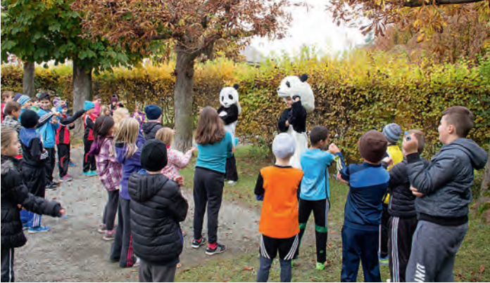
Freiwillige sind auch dabei, wenn die WWF-Läufe durchgeführt werden. Sie gehören auch zum Aufgabenbereich der neuen Freiwilligen-Koordinatorin.

Der WWF Bern wird Teil des Regionalbüros Bern-Solothurn-Oberwallis. Zusammen gleisen die drei Sektionen ihre Freiwilligenarbeit neu auf.