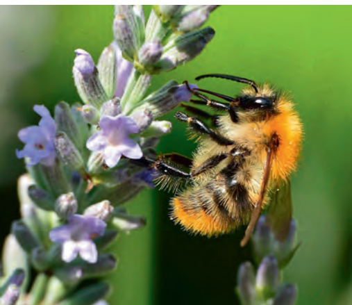
Auch die Hummel zählt zu den Wildbienen.

Seit vielen Jahren setzt sich der WWF für den Erhalt der Biodiversität und somit für den Schutz von Wildbienen ein. Dieses Schuljahr widmen wir ihnen unsere WWF-Läufe.