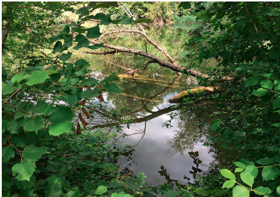
Kennzeichnend für die Alte Aare ist die Verschmelzung von Umgebung und Fluss.

Wer Schönheit und Ruhe erleben und die Natur geniessen will, braucht nur die S-Bahn zu nehmen. Zwischen Büren an der Aare und Lyss gibt es viel zu entdecken.