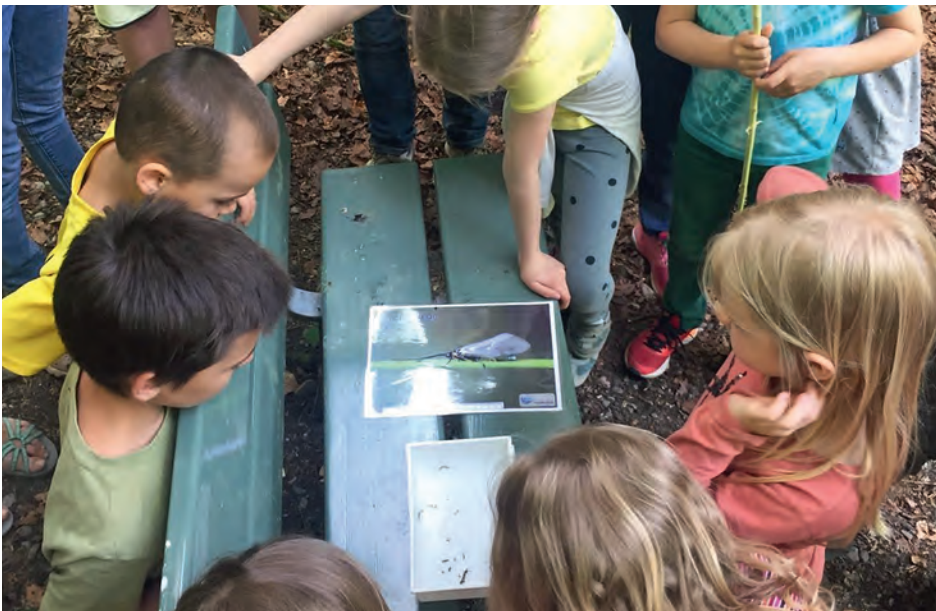
Die Feuersalamander-Larven werden von allen Seiten her bestaunt.