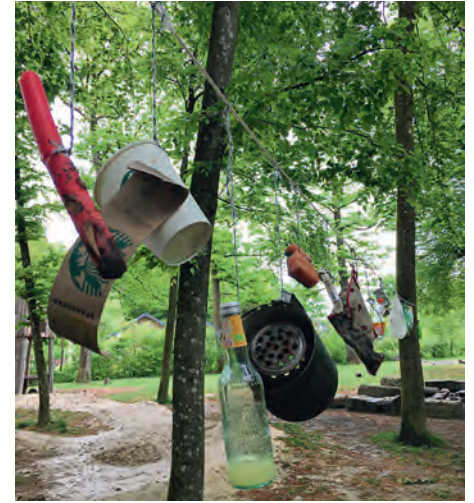
Die Abfallbeispiele sollen die Waldbesucher sensibilisieren.

Dieser «Litter», d.h. der in geringen Mengen achtlos weggeworfene Siedlungsabfall, ist nicht nur ein ästhetisches Problem. Gelitterte Materialien lassen sich nicht in Stoffkreisläufe zurückführen und