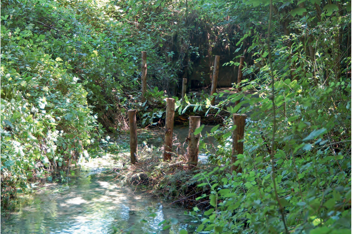
Die gebauten Bunnen unterteilen das Bachbett in verschiedene Bereichen und lassen so vielfältige Lebensräume entstehen.