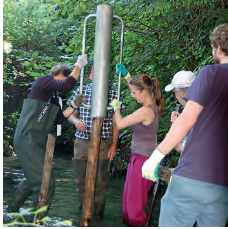
Um dem Bach mehr Strukturen zu geben, rammen die Freiwilligen mit Pfahlrammen Pfähle in den Bachgrund (links). Zwischen die Pfähle stecken sie dann Wurzelstöcke und grössere Äste.