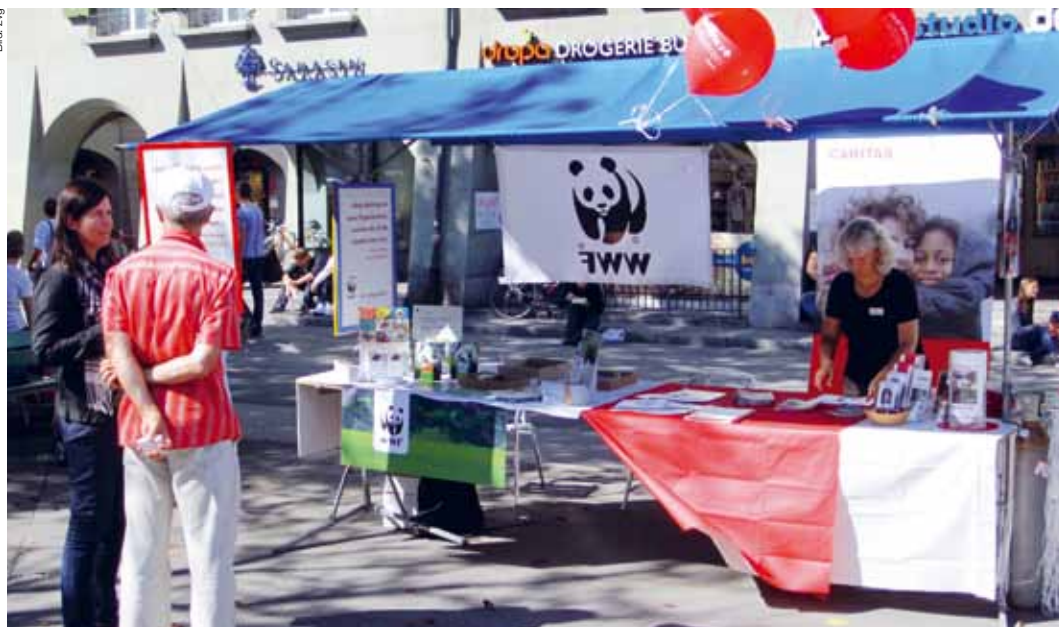
Der WWF war an «Let's fätz für freiwilligi Schätz» mit einem Stand präsent.