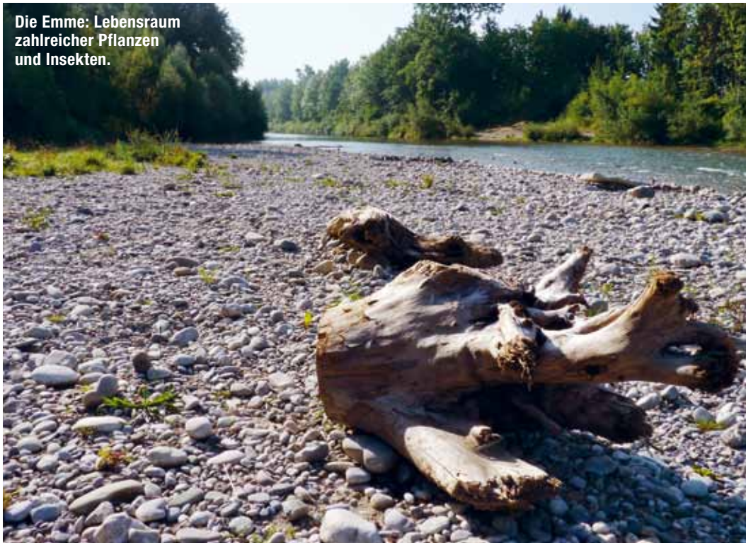
Die Emme: Lebensraum zahlreicher Pflanzen und Insekten.