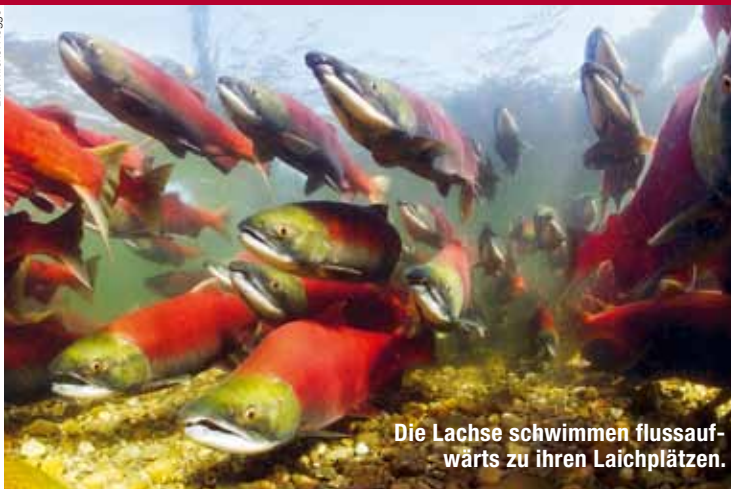
Die Lachse schwimmen flussaufwärts zu ihren Laichplätzen.