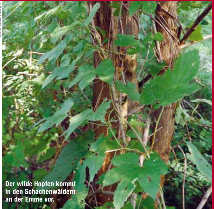
Der wilde Hopfen kommt in den Schachenwäldern an der Emme vor.

Ein neues Projekt will mit Unterstützung des WWF Licht ins Dunkel bringen und die Naturschätze zusammentragen, die an verschiedenen Orten schlummern. Einmal aufbereitet, kann das Wissen mit der gebührenden Rücksicht auf die Empfindlichkeit der Lebewesen für die Allgemeinheit nutzbar gemacht werden.