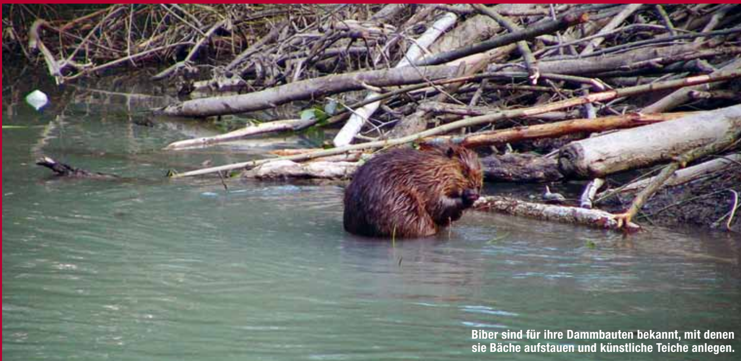
Biber sind für ihre Dammbauten bekannt, mit denen sie Bäche aufstauen und künstliche Teiche anlegen.