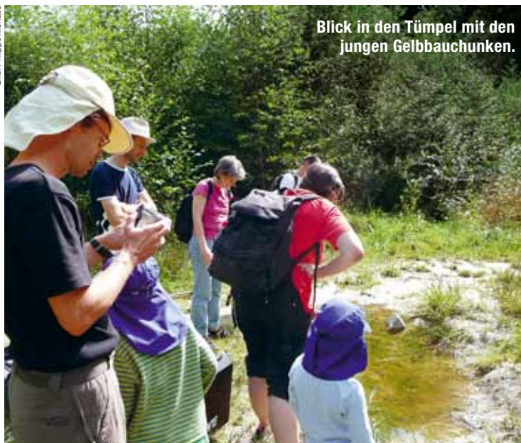
Blick in den Tümpel mit den jungen Gelbbauchunken.