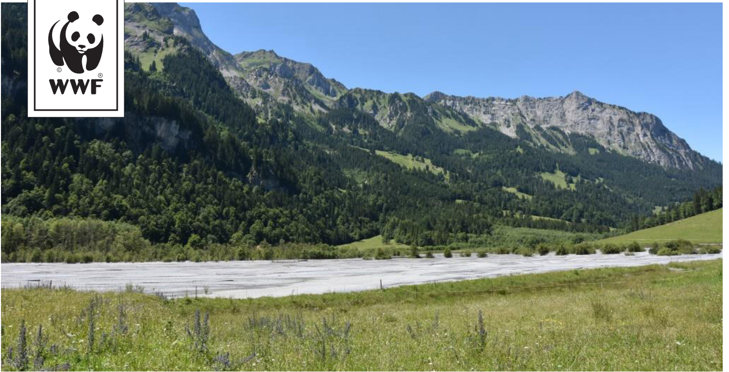
Chiene / Gornernbach